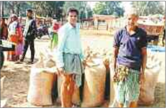
धान खरीदी केंद्र में इंतजार करते किसान।