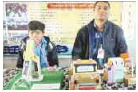
लिया जिसमें प्रथम, द्वितीय व तृतीय स्थान प्राप्त विजेताओं को पुरस्कृत किया गया जिसमें सम्बंधित स्कूलों के शिक्षक बच्चे तथा एपीसी समग्र शिक्षा उपस्थित रहे।