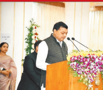
कैबिनेट मंत्री पद की शपथ लेते लखनलाल देवांगन।