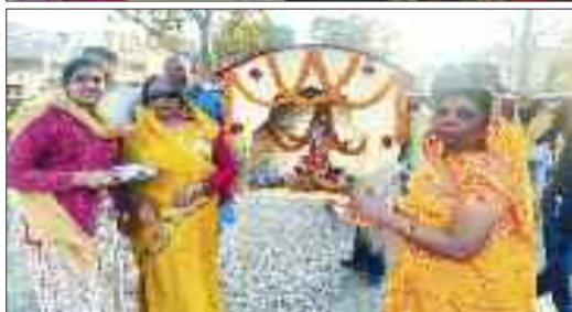
पालकी यात्रा में शामिल श्रद्धालु।

पालकी यात्रा में जहां साईं भक्त जहां बाबा के जयकारे पूरे जोश से लगा रहे थे वहीं महिलाएं साईं भजन गाते हुए चल रही थीं जिससे नगर का माहौल पूरी तरह साईंमय नजर आया। साईं मंदिर समिति ने बताया कि इस वर्ष धूमधाम से साईं बाबा की पालकी का आयोजन समिति द्वारा किया गया। उन्होंने बताया कि वर्षों से इस परंपरा का निर्वहन किया जा रहा है जिसमें नगर के साईं भक्त शामिल होते हैं। जिसके उपरंत मंदिर प्रांगण में